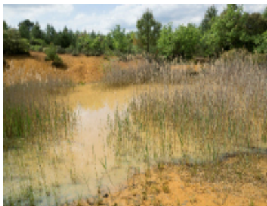
Trou des Américains