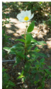
Ciste à feuille de laurier

La colline de la Bruyère a reçu le label départemental «Espace Naturel sensible» (E.N.S.) en 2005. Dans ce cadre, plusieurs parcelles (45 ha) seront gérées par le Parc naturel régional du Luberon et le Conservatoire d'espaces naturels de la Région Sud dans un objectif de préservation du patrimoine naturel. La gestion de cet E.N.S. est réalisée en partenariat avec le Conseil départemental de Vaucluse. Ces terrains sont ouverts au public (uniquement sur les sentiers balisés) dans les limites compatibles avec la préservation de cet écosystème.