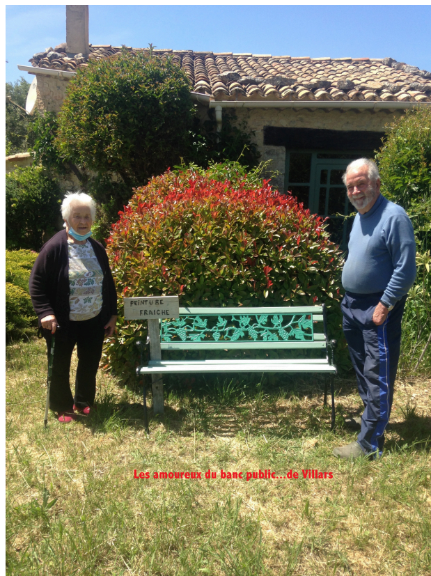
Les amoureux du banc public... de Villars