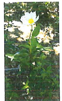
Ciste à feuille de laurier