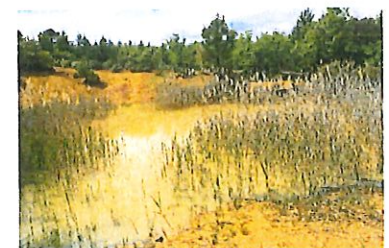
Trou des Américains