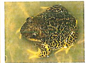
Pelobates cultripes, adulte